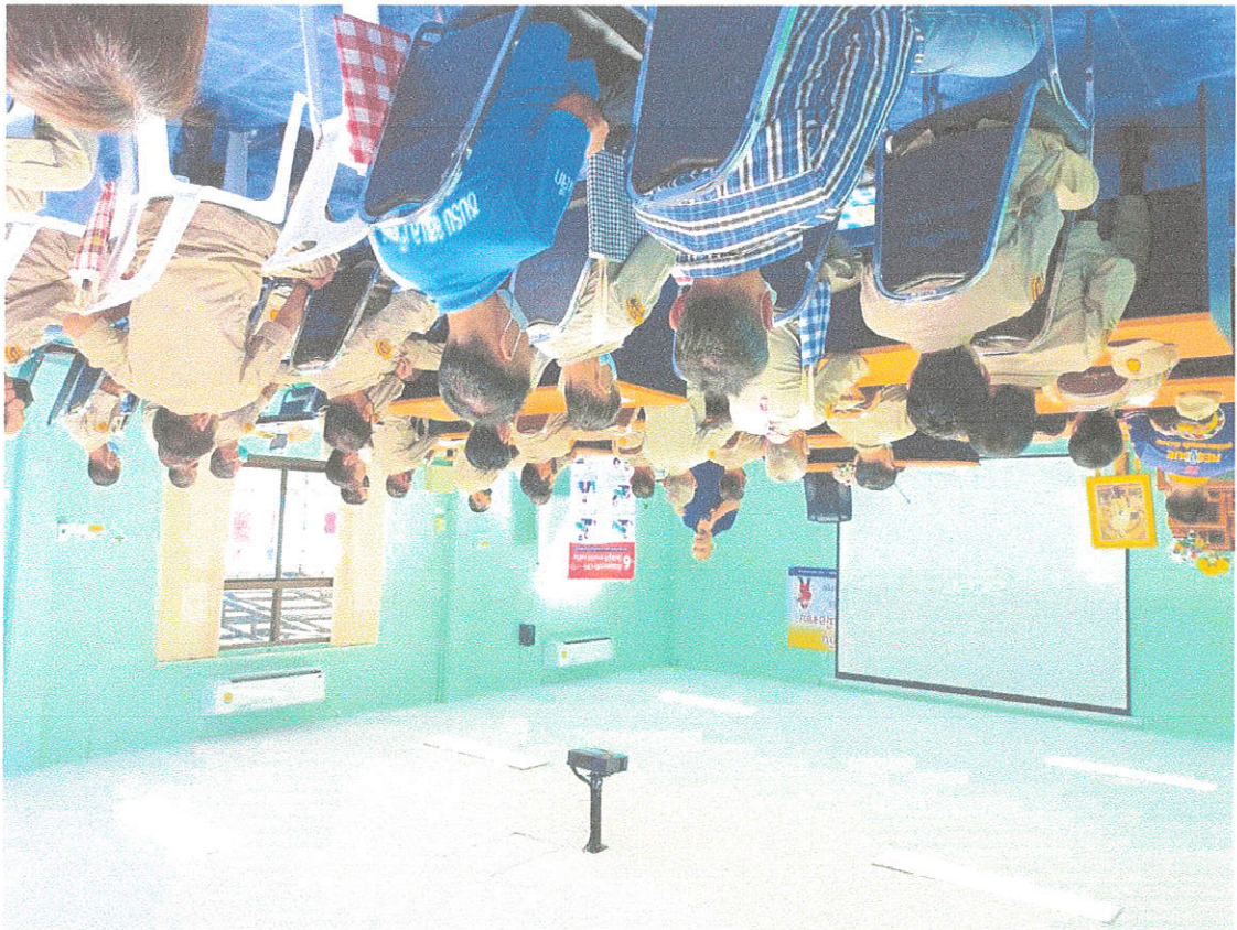
គណៈប្រតិភូ