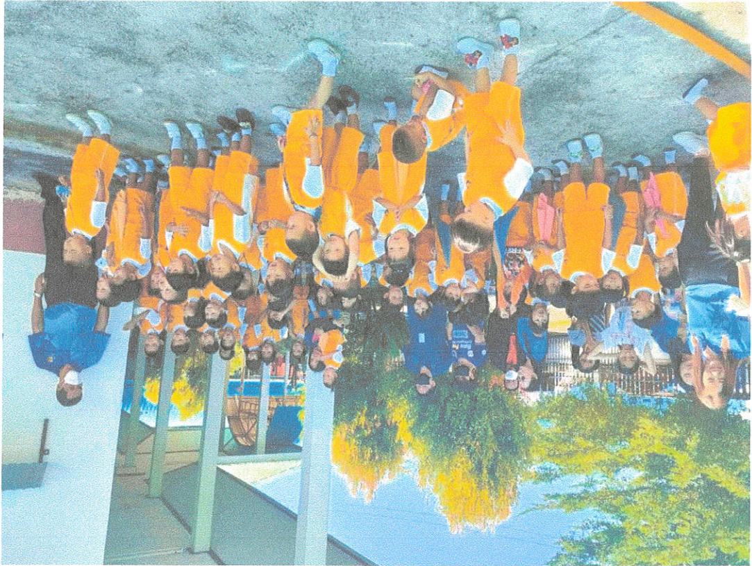
វិទ្យាសាលា