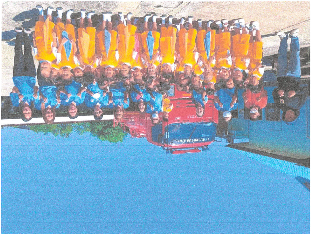
การอบรมบุคลากร